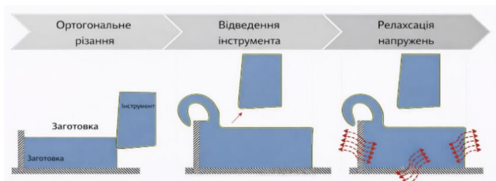
Рис. 3. Схематичне зображення процесу формування залишкових напружень під час ортогонального різання [38]

Чисельне моделювання ортогонального різання сталі AISI 4140 є ефективним інструментом для аналізу фізико-механічних процесів, що відбуваються в зоні різання. За допомогою методів скінченних елементів (FEM) моделюють формування стружки, розподіл температурних полів, напружень та деформацій, а також зношування ріжучого інструменту. Такий підхід дає можливість відтворити умови реального експерименту, прогнозувати параметри якості обробленої поверхні та оптимізувати режими різання. На рисунку 3 наведено схему формування залишкових напружень під час ортогонального різання, що включає етапи різання, відведення інструмента та релаксації.